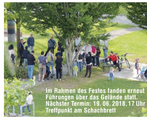
Im Rahmen des Festes fanden erneut Führungen über das Gelände statt. Nächster Termin: 19.06.2018, 17 Uhr Treffpunkt am Schachbrett

Wer dabei war, hat es genossen. Wer es verpasst hat, ist nächstes Jahr vielleicht dabei. Der Fliednerplatz und der schöne Park mit der Lazaruskirche verkraften übrigens auch zwei Veranstaltungen nebeneinander: Während am Fliednerplatz spanische Musik erklang, wurde in der Kirche eine Hochzeit gefeiert.